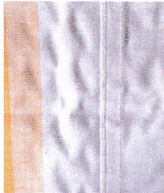
Welligkeit im Nahtbereich.